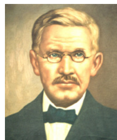
Friedrich Wilhelm Raiffeisen